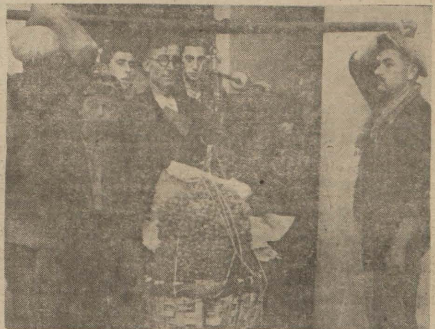
Hâlde üzüm satışı (Yazısı 5 inci sayfa)

Dün manavlar ve sebzeçilerle konuştuk: “Ömrümüzde bu derece pahalılık görmedik. Sinek avlıyoruz,, diyerek pahalılığın sebeplerini anlatıyorlar