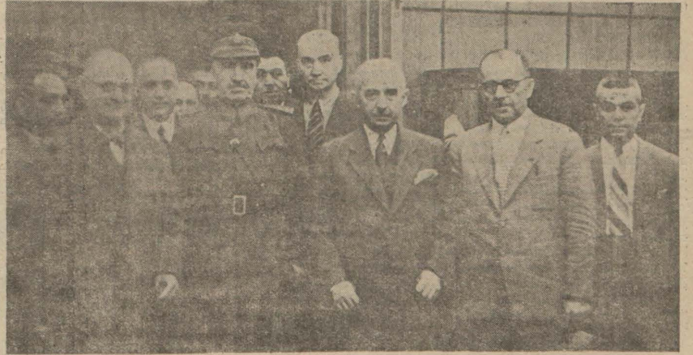
Orta Anadolu'da tetkik seyahatine çıkan Millî Şef Ankara'dan ayrılırlarken

Sivrihisar 21 (A.A.) — Aziz Millî Şefimiz İsmet İnönü bugün saat 10 da kazamızı şereflendirmişler ve binlerce halk tarafından yaşa varol sadaları ve sürekli alışkanlıklarla karşılanılmışlardır. Hükümet bahçesine inen büyük misafirkında izahat aldıktan sonra köyümüz yanlarına köy muhtarını ve çiftçileri kabul buyurarak kendilerinden kazanın zirai durumu hakkında izahat aldıktan sonra köyümüz yanlarına köy muhtarını ve