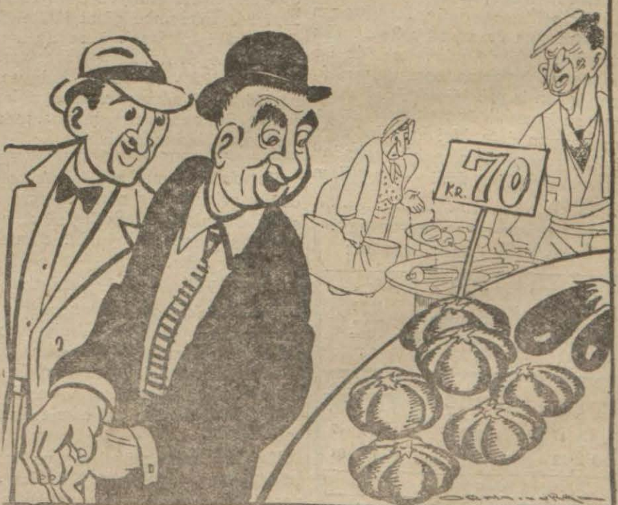
— Şu domateslere bak, nasıl kızarmışlar... — Görüyorum, üstlerine konan fiattan utanmış olacaklardır. ...