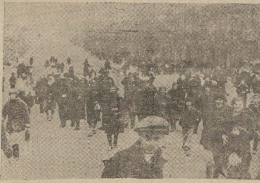
Rostofun Ruslar tarafından istirdadı sırasında alınmış bir resme